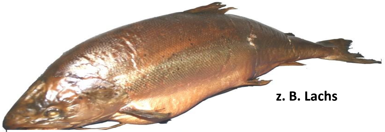
z. B. Lachs